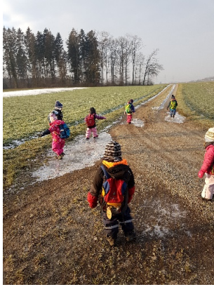
Gratis Eisfeld im Winter