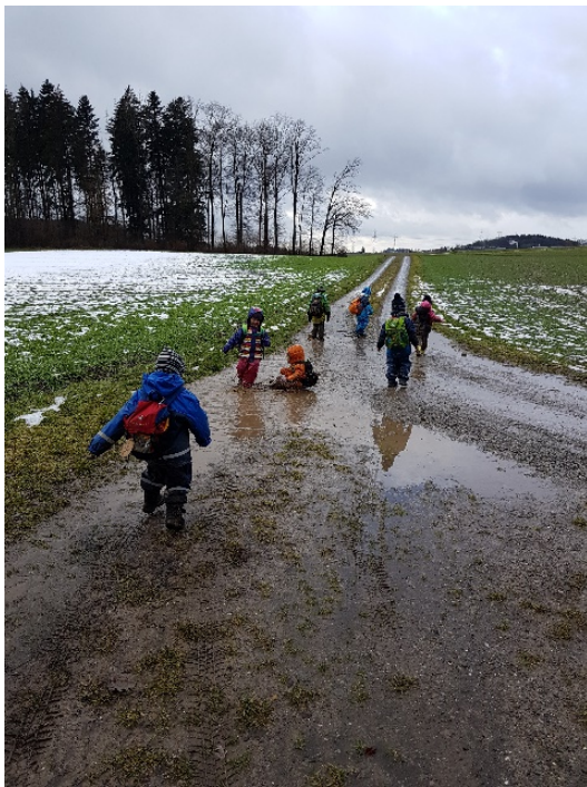
Pfützen hüpfen! Juppiiiiiii

Aber das Highlight war, wenn es regnete auf dem Nachhauseweg: