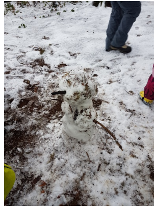
Auch der Schneemann durfte nicht fehlen

Aber das Highlight war, wenn es regnete auf dem Nachhauseweg: