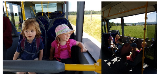
und mit dem Bus retour

Es war wieder ein wundervolles Jahr und wir bedanken uns ganz herzlich bei allen Kindern für die tolle Zeit die wir mit euch erleben durften!