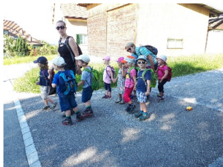
Zu Fuss hin

Kurz vor den Sommerferien machten wir einen Ausflug auf den Strickhof