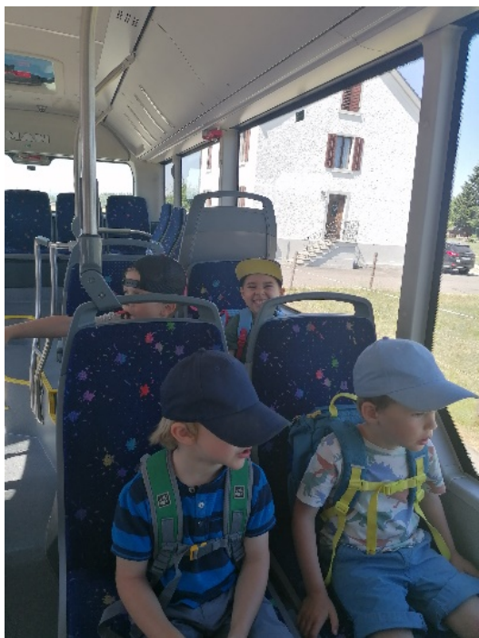
Zu Fuss hin